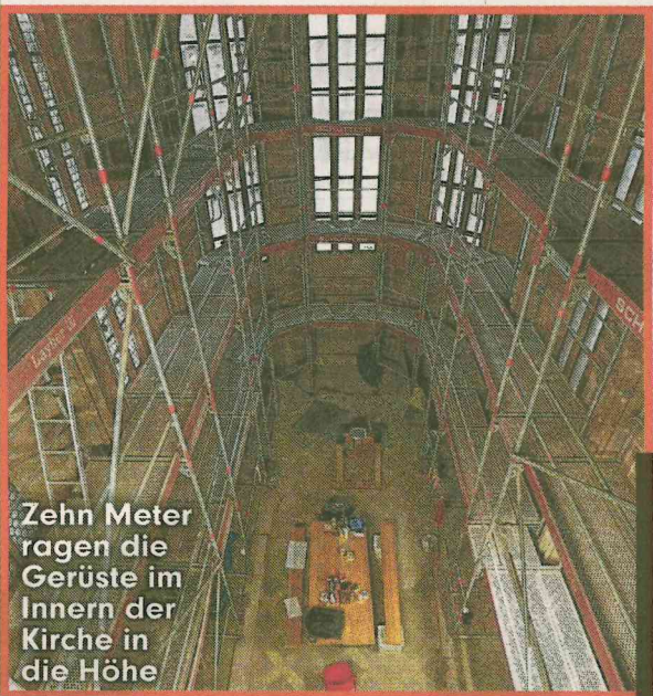
Zehn Meter ragen die Gerüste im Innern der Kirche in die Höhe